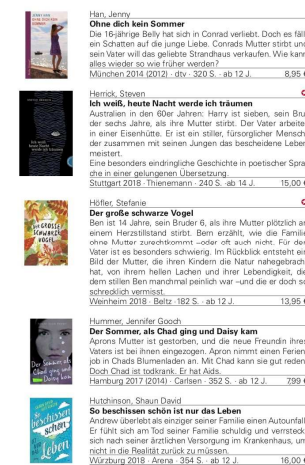
KIND UND TOD - Jugendbücher – 45 –