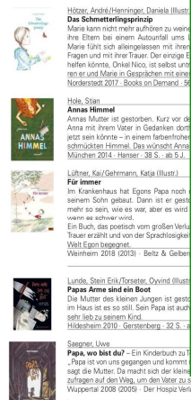
– 12 – Angelika Hunger - Annelore Enge