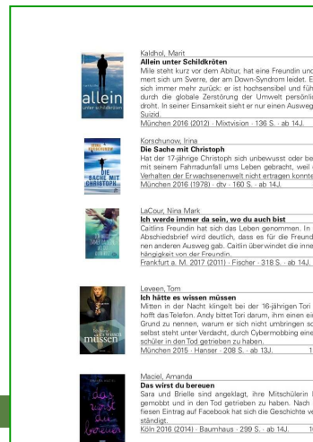
KIND UND TOD - Jugendbücher – 61 –